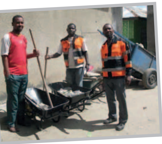
(© Nell Hamilton)

Mansipaa Jamii Vikokotoni ni jumuiya ya mji Mkongwe wa Zanzibar inayofanya kazi ya kusafisha vichocho katika shehia zao. Wajumbe (wanachama) 30 kila siku wanafanyakazi ya kufagia na kukusanya takataka na vifaa vinavyosarifika vilivyotengwa na kuviuza au kutmika tena kama vitu vipya. Shughuli hizo zinafadhiliwa kupitia huduma za usafishaji mitaro, utengenezaji wa mapambo kutokana na takataka za karatasi, na maka kutokana na unga wa maka .