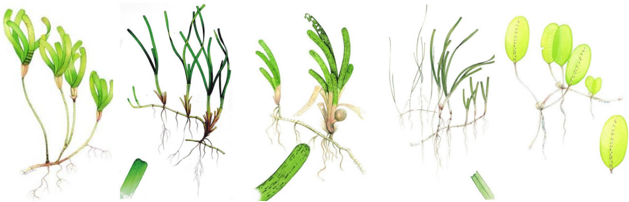
Thalassodendron ciliatum Thalassia hemprichii Cymodocea rotundata Halodule sp. Halophila ovalis

Nyasi bahari zimepata jina lake hilo kwa sababu aina nyingi zina majani marefu membamba kama nyasi zinazoota nchi kavu. Namna nyasi bahari zinavyoota pia zinafanana zikiweka bustani sehemu yenye mchanga, chini ya bahari, kama shamba lenye nyasi. Ziko aina nyingi tofauti za nyasi bahari, lakini si, zote ziliofanana na nyasi. Spishi nyingine zina majani yenye simbola makasia madogo (mviringo), wakati nyengine zina umbo la utepe 'ferns' au hata nyembamba kama tambu. Chini ya majani yake, mmea wa nyasi bahari una kigogo na mizizi. Kama zilivyo nyasi halisi, kigogo cha nyasi bahari huota usawa wa ardhi. Kigogo hiki kilichokuwa vya kutosha, kinaitwa rizomu . Rizomu hufanywa kwa vipande, na kwenye viungo baina ya sehemu hizo, au vifundo, huota mizizi kwenda chini na hufyonza maji na virutubishi. Vigogo na majani – ile sehemu tunayoweza kuiona huota kuja juu.