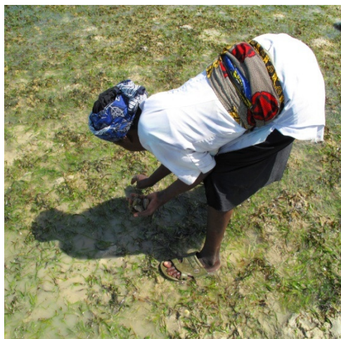
Mtafutaji wa wanyama wasikwe na ngongo akiokota kombe/chaza kwa chakula chake katika kitalu cha nyasi – zanzibar

ya mifugo ya nyasi bahari katika Zanzibar. Hii ni njia nzuri ya kuongeza kipato na hamirojo (protini) katika mlo.